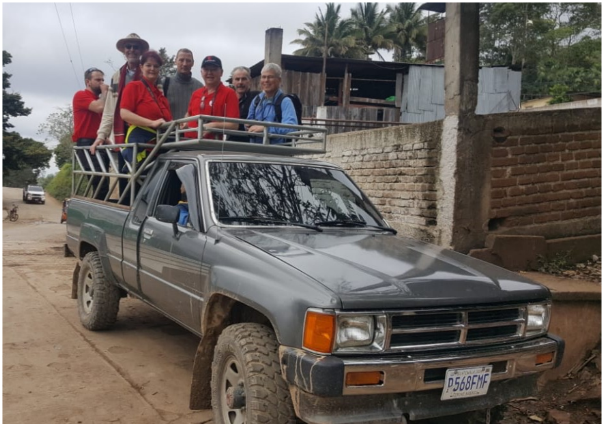
Auf dem Pickup nach Lampocoy - Reisegruppe 2019

„ Kaffee hautnah “ ist die Devise unserer jedes Jahr stattfindenden Reise durch das Land des ewigen Frühlings.